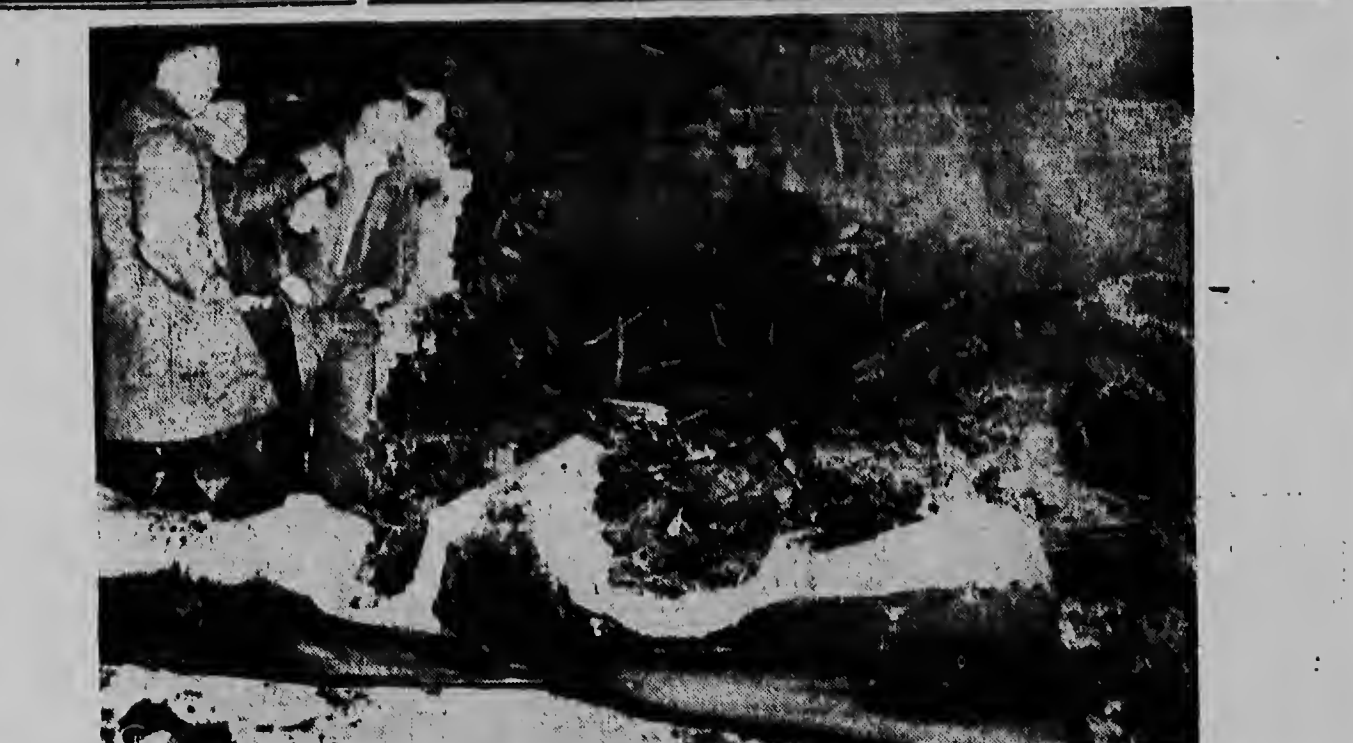
60 ABORDO, NINGUN A MURI — Bomberonan ta examina resto di un avion cu a kibra. Ta un DC-68 di Northwest Airlines despues di a cayi cu 60 hente abordo, ora cu e tabata bai subiendo na aeropuerto Wold-Chamerlain Minneapolis, Minn. E tabata di haci e blaha pa Seattle, Wash. Un milagro cu ningun hende a muri den e accidente aki, como 49 mester en ningun hende a muri den e accidente aki, como 49 personamester a worde hospitaliza.

Unos indios, mercederos de marfil, le ofrecen dos gigantes colmillos a cambio de quinientas piezas de plata. El Kan ordena el pago de la suma sin vacilar un instante, mientras sus